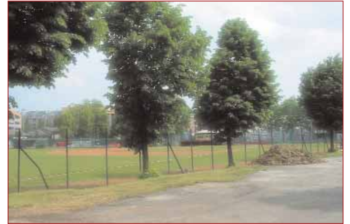
Lavori in corso al campo di baseball

La spesa complessiva per eseguire questa lunga serie di opere a servizi di baseball e calcio si aggirerà attorno ai due milioni e mezzo di euro.