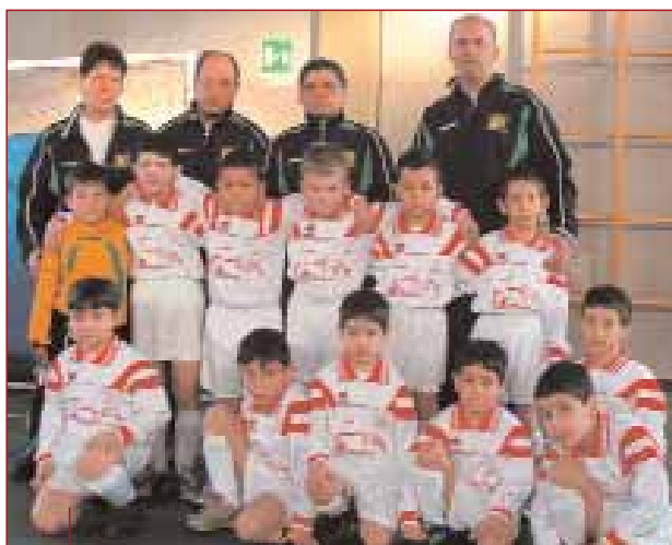
Una formazione di ragazzi della Polisportiva Solese

Giovedì 1 e venerdì 2 giugno si dovrebbe svolgere la manifestazione "Amici dell'Atalanta": il sodalizio pre-