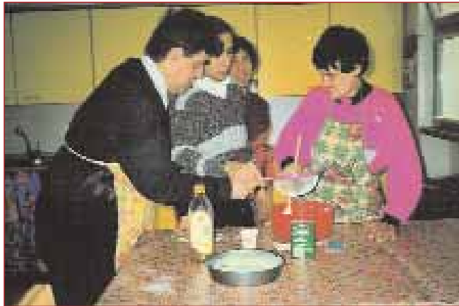
Attività al Centroanchio

Sperimentale da quest'anno è l'attività assistita con i cani, realizzata attraverso l'ausilio di un'esperta; gli ospiti del Centro imparano a familiarizzare e a giocare con esemplari di Golden retriever e Labrador. Un gruppo di quattro ragazzi in carrozzina si cimenta invece da tre anni in una rarità di Teatro sociale. Ancora, dall'attività svolta dal Gruppo Musicale è nata una vera band di 12 componenti che si esibisce in serate e concerti. Realizzano inoltre iniziative con il WWF delle Groane a favore dell'Oasi del Caloggio. Infine gli artisti "Figli di Scavaggio" diventano espositori organizzando mostre d'arte per presentare le loro opere pittoriche.