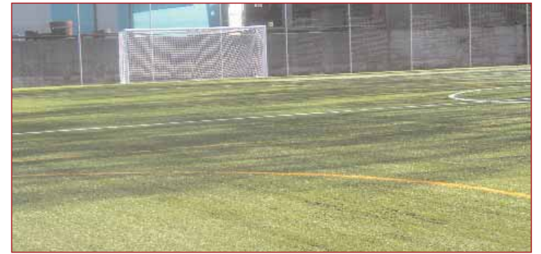
Una delle due vasche scoperte dell'impianto di via Dante e uno dei campi per il calcio