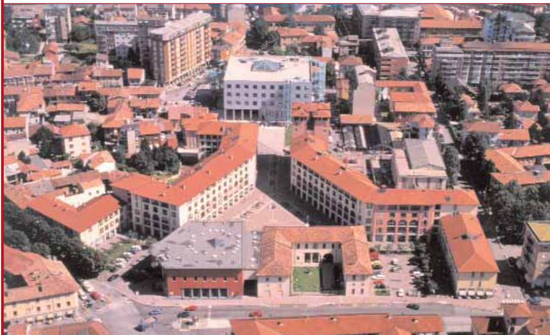
Minialloggi per gli anziani, le "stecche" di via Turati e la voce di tre storiche Cooperative edificatrici locali fotografano la situazione abitativa attuale di Bollate: "di qua e di là dalla Ferrovia"

Cercar casa a Bollate sta diventando sempre più difficile? Dall'edilizia convenzionata alle case popolari, dall'acquisto della prima abitazione per le giovani coppie agli affitti agevolati; ecco come guarda al domani l'Amministrazione comunale