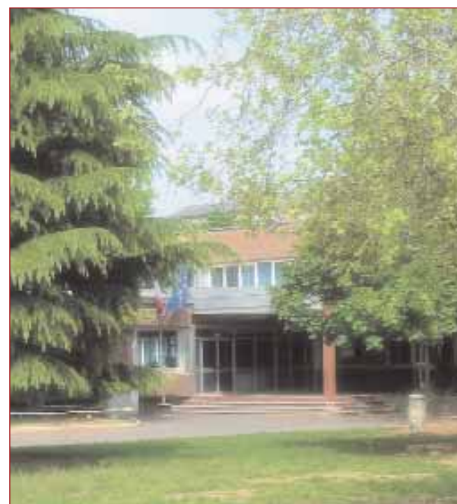
La scuola di via Montessori che sarà ampliata